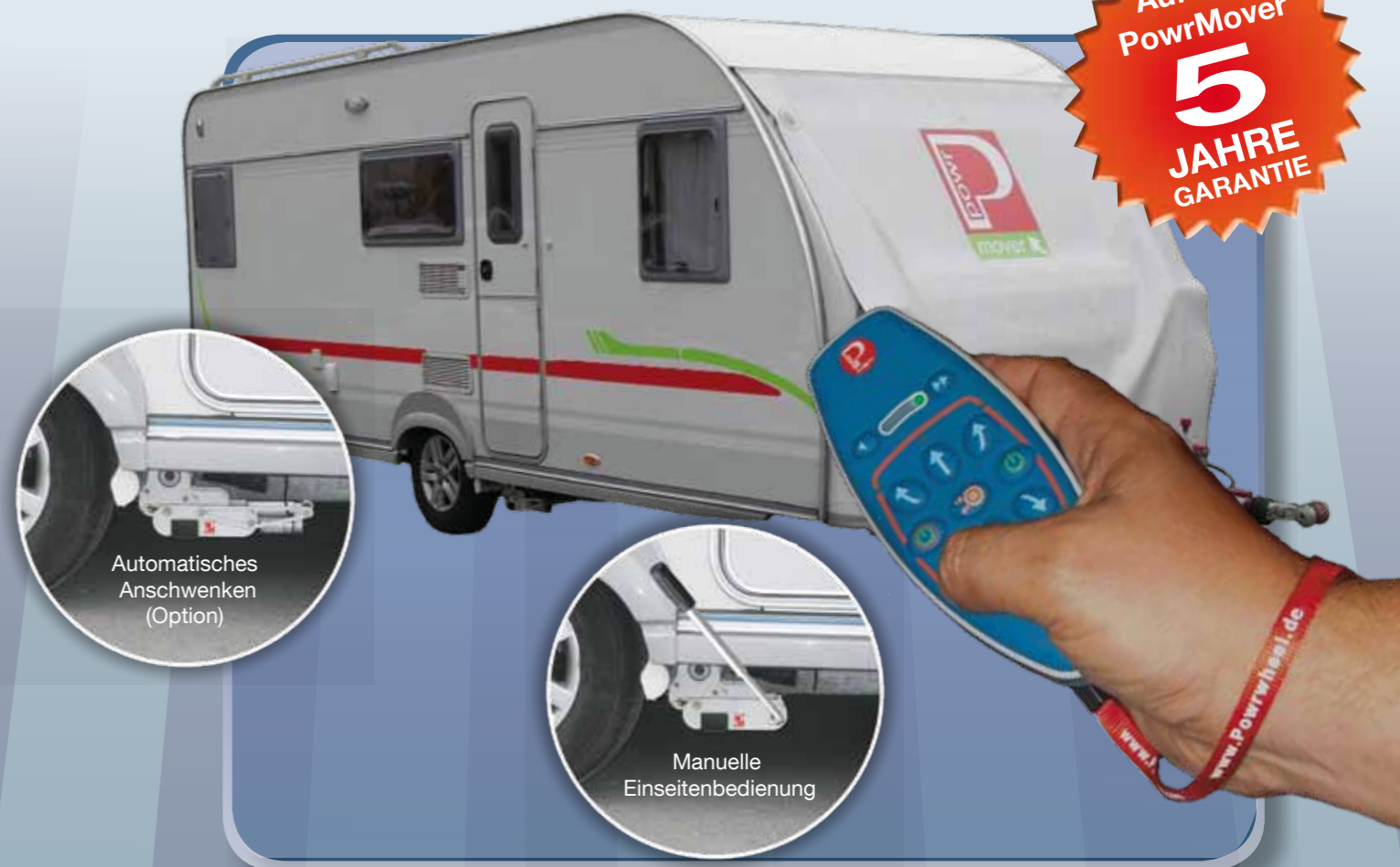
Automatisches Anschwenken (Option)