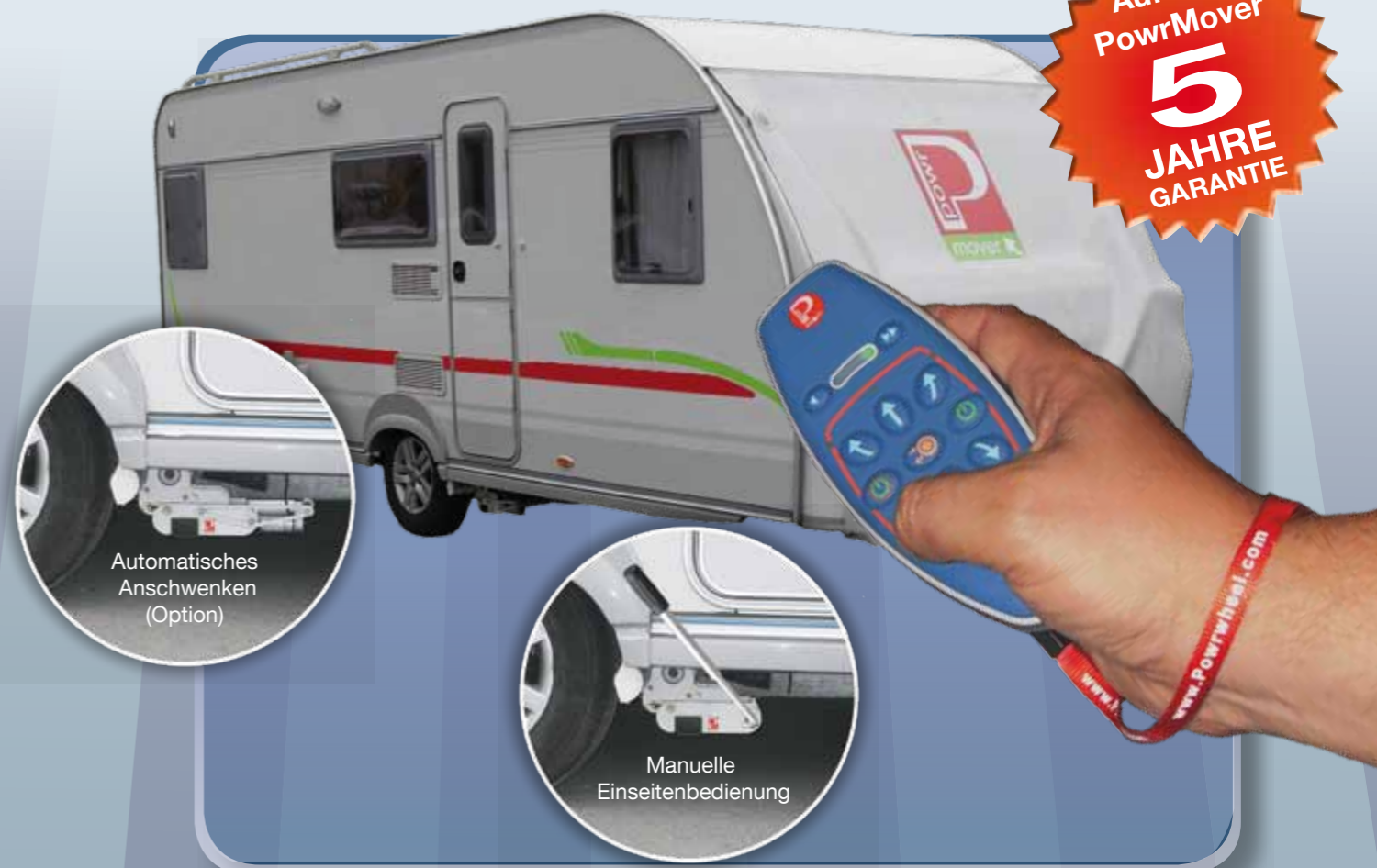
Automatisches Anschwenken (Option)